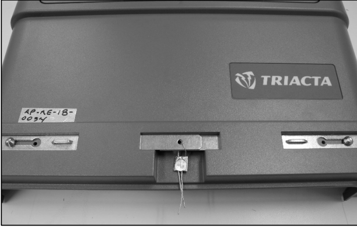
Utility Seal / Sceau de service public