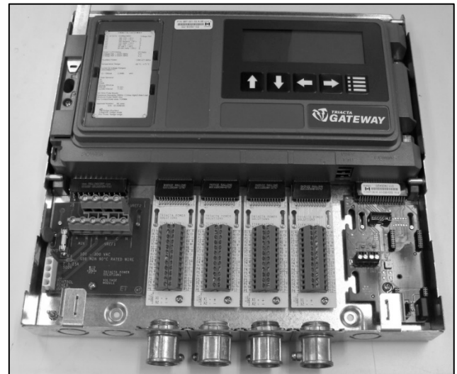
Terminals / Bornes