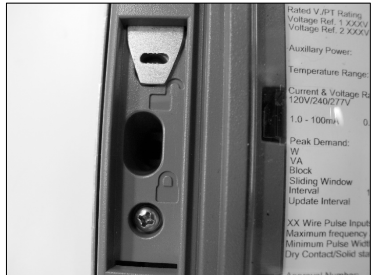
Programming Switch / Interrupteur de programmation